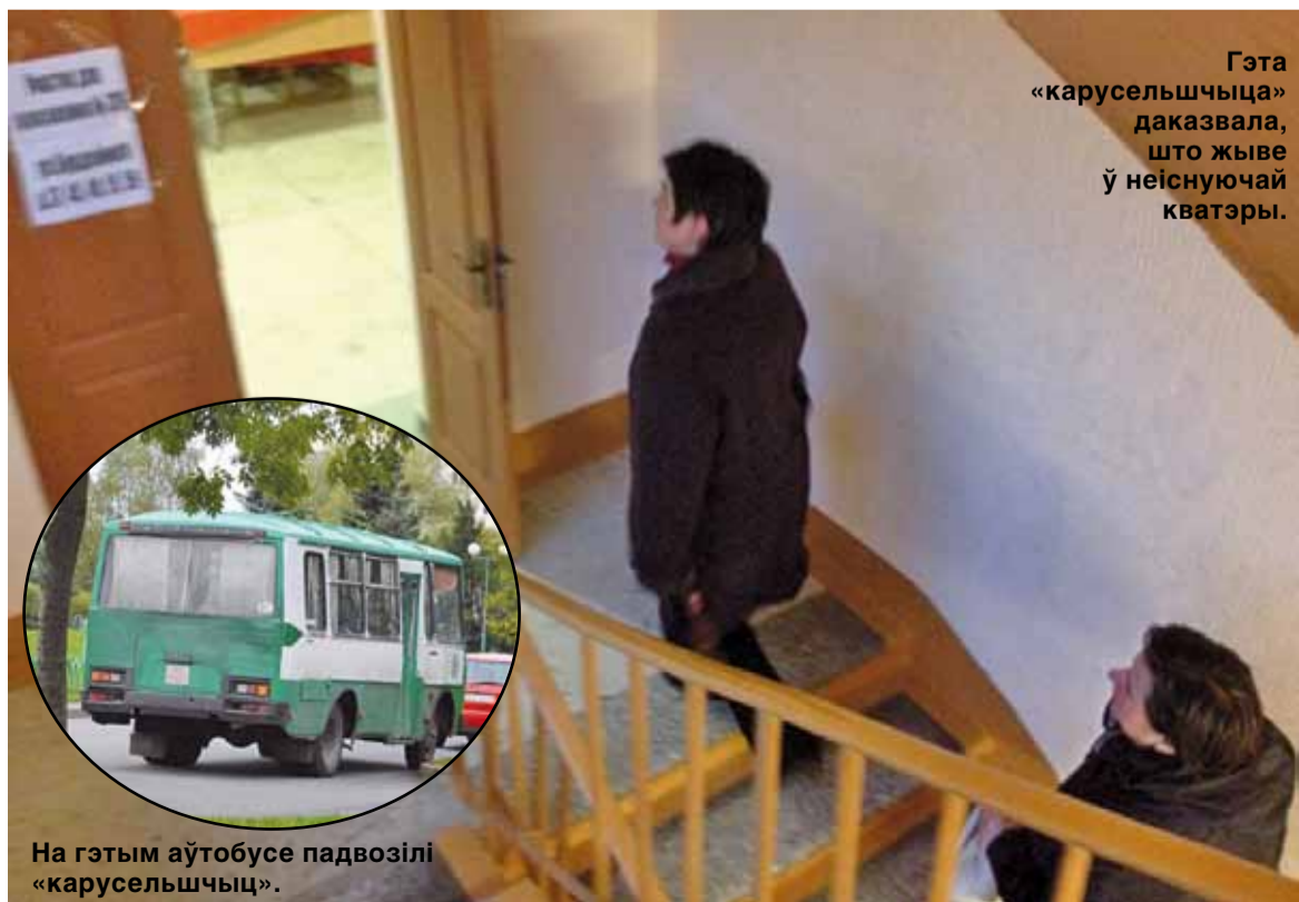
Гэта «карусельшчыца» даказвала, што жыве ў неіснуючай кватэры.