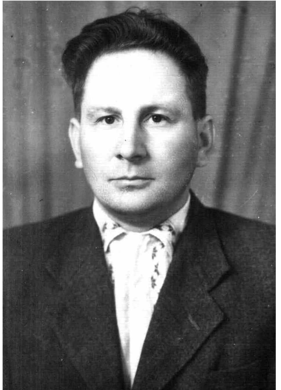
Юльян Пшыркоў у 1953.

(31 кастрычніка 1912 — 23 снежня 1980), літаратуразнавец. Доктар філалагічных навук, прафесар. Лаўрэат Дзяржаўнай прэміі БССР імя Якуба Коласа. Нарадзіўся ў в.Кісцяні на Рагачоўшчыне. Скончыў педагагічныя курсы ў Рагачове (1930); працаваў настаўнікам. Скончыў філалагічны факультэт Ленінградскага дзяржуніверсітэта (1939). З 1940 — у савецкім войску, удзельнічаў у баях пад Ленінградам і Кёнігсбергам; быў тройчы паранены. З 1945 супрацоўнік, з 1954 — загадчык сектара беларускай дакастрычніцкай літаратуры і тэксталогіі Інстытута літаратуры АН БССР. У артыкулах «Новая зямля Я. Коласа» і «Дарэвалюцыйныя паэмы Я. Купалы» (абодва — 1940) адзін з першых выступіў з пераглядам вульгарна-сацыялагічных ацэнак гэтых твораў. Аўтар даследаванняў «Якуб Колас. Жыццё і творчасць» (1951, першая манаграфія ў коласазнаўстве), «Трылогія Якуба Коласа «На ростанях» (1956), «Беларуская савецкая проза. 20-я — пачатак 30-х гадоў» (1960), «А. Е. Богдановіч» (1966) і інш.