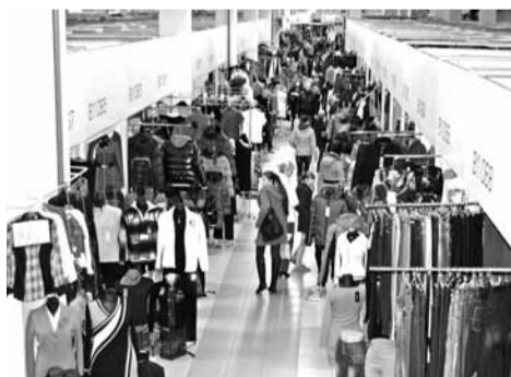
Даведка. Рынак Гарунай

Спачатку гаспадары Гаруноў збудавалі чатыры вялікія «тэматычныя» ангары. Напрыклад, у адным з іх прадаюцца аўтамабільныя тавары, у другім садовая тэхніка. Праўда, даверу да такіх збудаванняў у прадаўцоў няма.