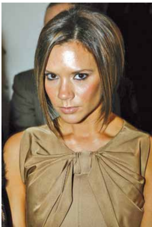
Брытанцы, паводле апытання сайта Jaskrotjoу, выбралі самую паную знакамітасць. Ёй стала Вікторыя Бэхэм.