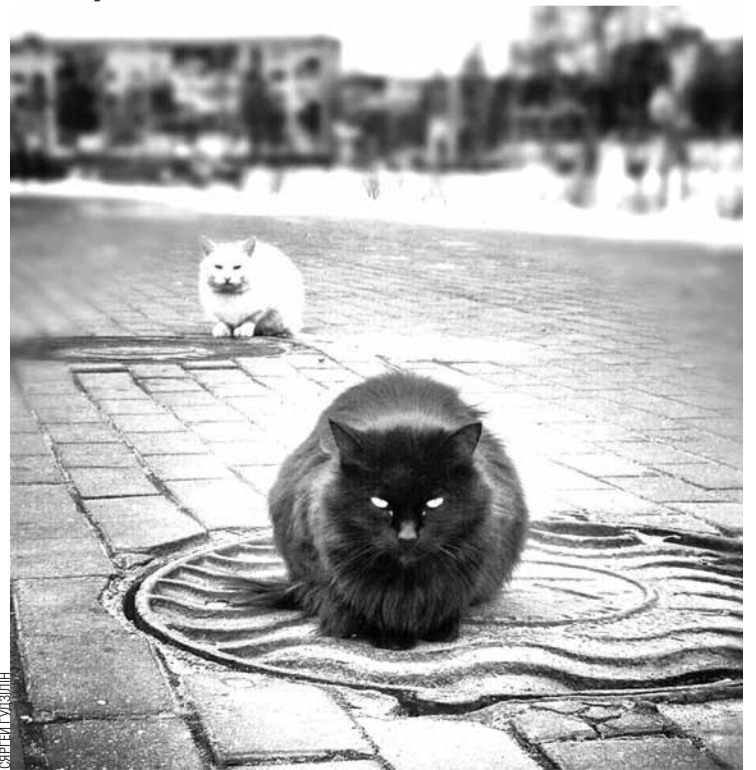
Беспрытульныя каты ў маразы грэюцца на каналізацыйных люках