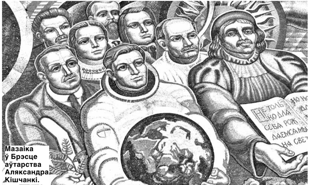
Мозаіка ў Брэсце аўтарства Аляксандра Кішчанкі.