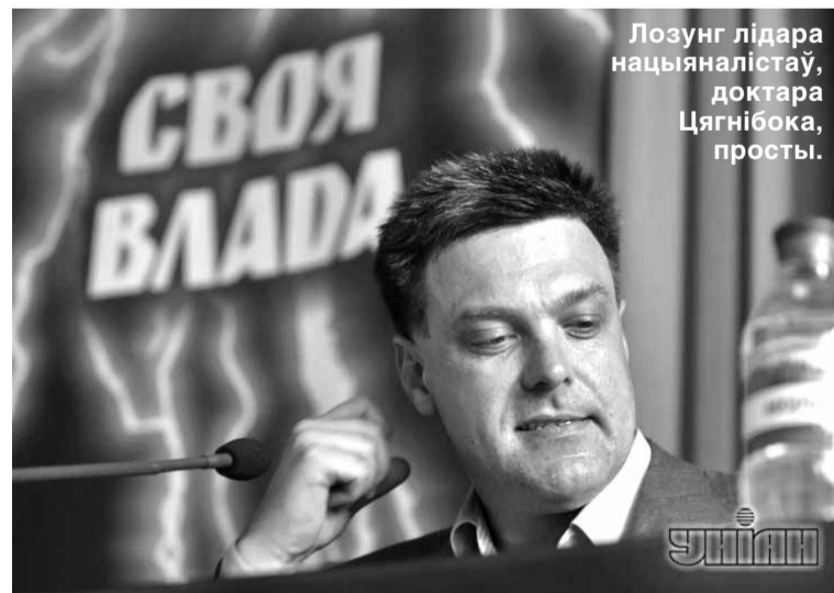
Лозунг лідара нацыяналістаў, доктара Цягнібока, прасты.

Поспех Ільенкі — гэта знак часу. Ён кандыдат ад нацыяналістычнай