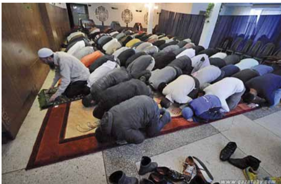
Курбан-Байрам адзначылі беларускія мусульмане. На фота: малітва гродзенскай грамады мусульман.