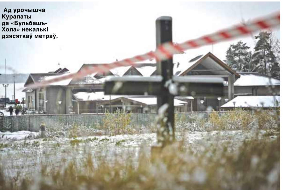
Ад урочышча Курапаты да «Бульбашь-Хола» некалькі дзясяткаў метраў.

У 2001 пасля ўпартага супрацьстаяння — моладзь на часе з маладым Севярыным нават пачала ў намётах — сітуацыя з МКАД вырашылася дастойна. Некропаль не парушылі, зрабілі прыгожыя падыходы.