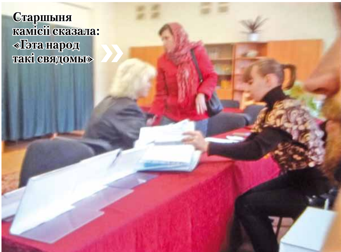
Гэта жанчына, па сцвярджэнні назіральніка, галасавала не менш за два разы.

Старшыня камісіі сказала: «Гэта народ такі свядомы»