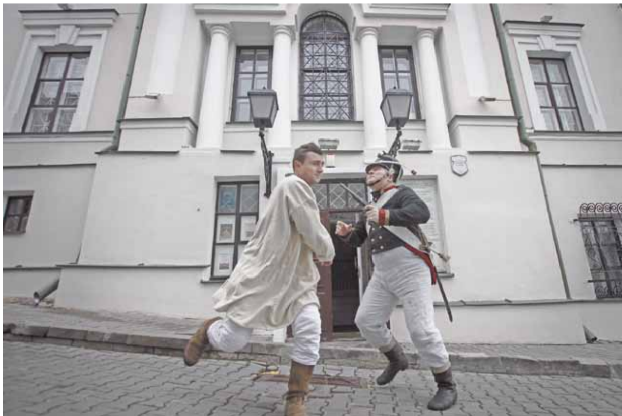
Турыстычная кампанія «Кола падарожжаў» зладзіла незвычайны турыстычны прома-тур па беларускай сталіцы. Падчас экскурсіі ў Музычным завулку, каля Дома масонаў, адбылася інсцэнізацыя затрымання апошняга сябра масонскай ложы «Паўночная паходня».